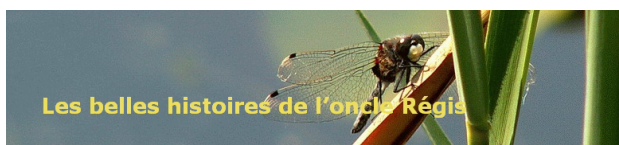
Les belles histoires de l'oncle Régis